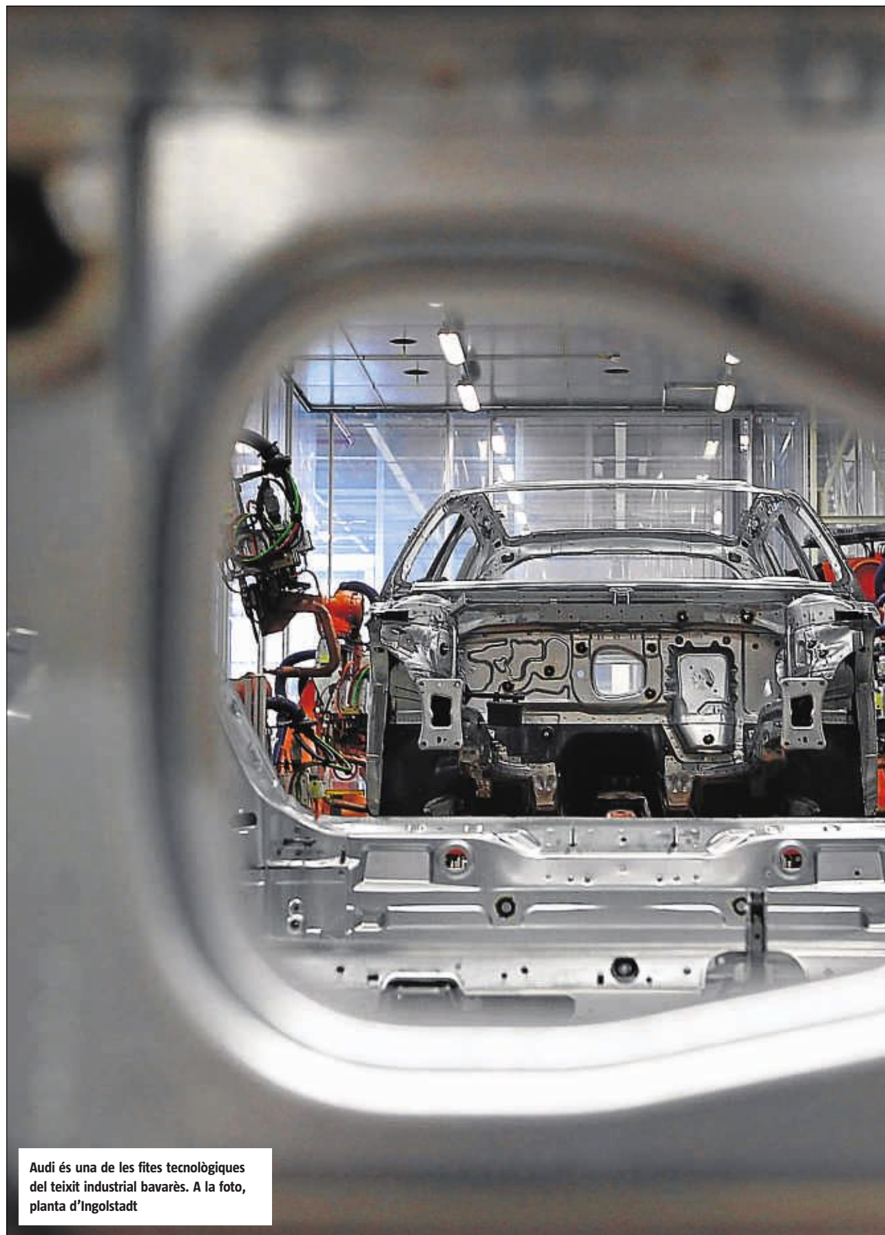
Audi és una de les fites tecnològiques del teixit industrial bavarès. A la foto, planta d'Ingolstadt

Si els grans conglomerats siderúrgics del Ruhr van formar el nucli de la indústria germànica fins a mitjan anys seixanta, el